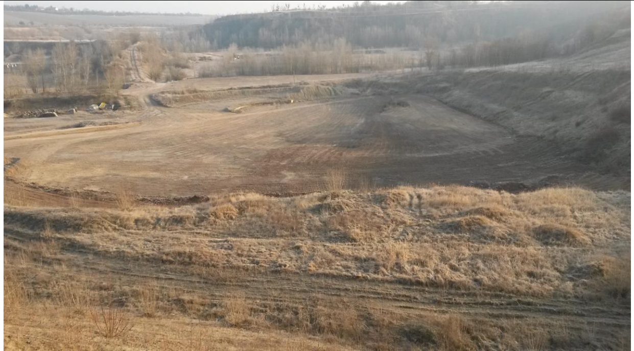
Bild 13: Blick von West nach Ost auf den Teil der geplanten DK 0-Deponie. 21.02.2018