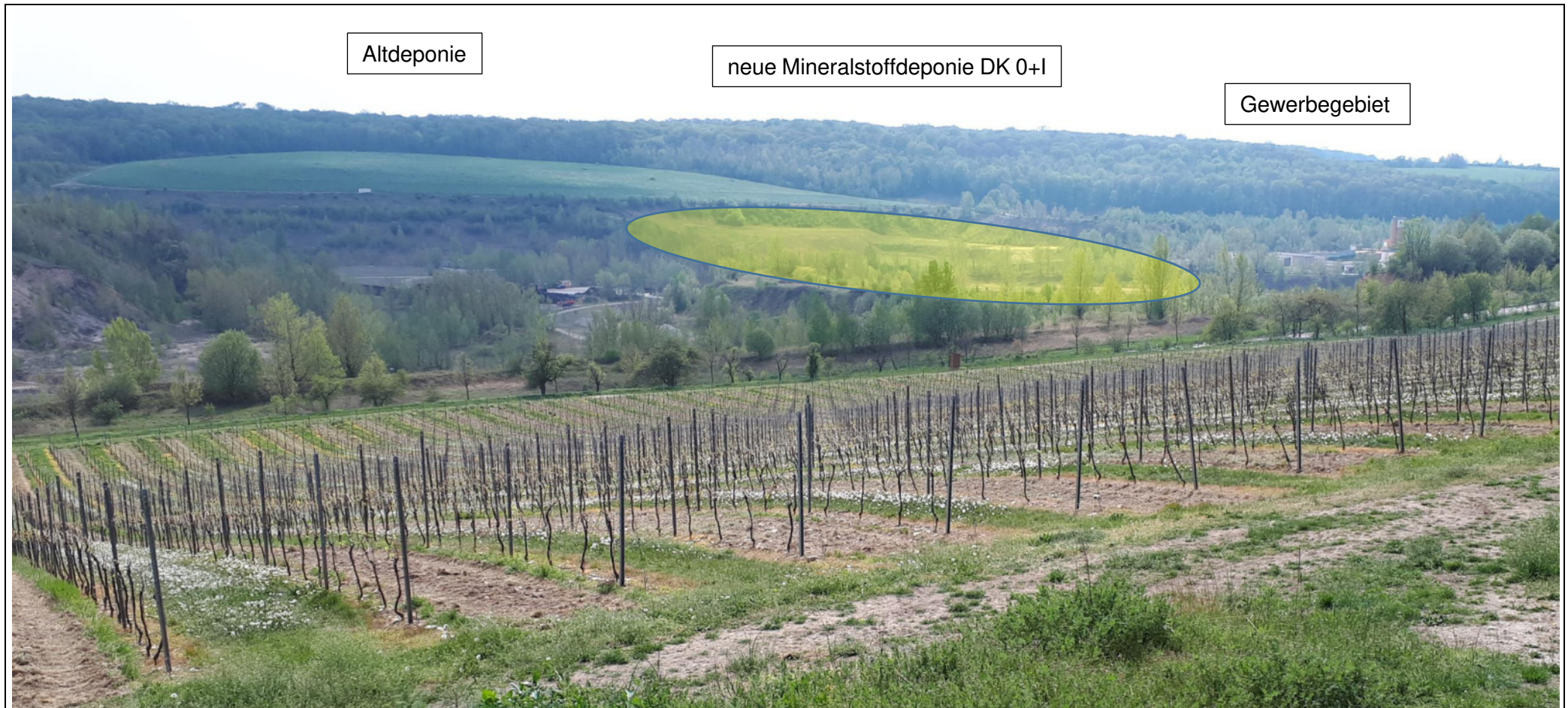
Bild 3: Geplante Lage der neuen Deponien DK0 und DK1 zwischen Altdeponie und Gewerbegebiet. Blick aus Richtung Schleberoda (Höhe Knick der K2640 südlich der Ortschaft) in Richtung Südwesten auf Altdeponie, Gewerbegebiet und die geplante Mineralstoffdeponie. Die geplanten Endhöhen der Mineralstoffdeponie werden sich sehr harmonisch in die Landschaft einpassen. Die bestehende Hohlform wird wieder aufgefüllt, so dass eine zukünftig eine Verbindung zwischen alter und neuer Göhle wiederhergestellt werden könnte.