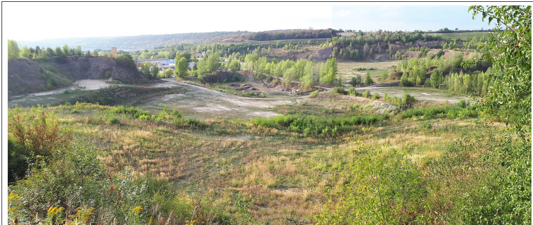
Bild 1: Übersichtsaufnahme von der Böschung der Altdeponie in Richtung Norden auf den Kiessandtagebau. Im Bildzentrum befinden sich die Flächen für die DK 0-Deponie, die sich bis zur Böschung auf der linken Bildseite erstreckt. Im Hintergrund sichtbar sind die Gebäude des Gewerbegebietes. In der rechten oberen Bildhälfte liegt die Fläche für die DK I-Deponie. Zwischen den beiden geplanten Deponieteilen verläuft die Zufahrtstraße (Betriebsstraße), umsäumt von Pappeln. 14.09.2018.