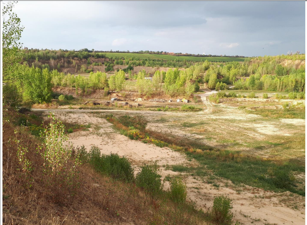
Bild 5: Blick von der Südwestböschung des Kiessandtagebaus in Richtung NNE auf den geplanten Deponieteil DK0. Hinter der Baumreihe in der Bildmitte (Zufahrtstraße) beginnt der Bereich DKI, der sich bis an die Böschungen im Hintergrund streckt. In der Bildmitte oberhalb des Hanges sind die Dächer der Ortschaft Schleberoda zu sehen. 14.09.2018