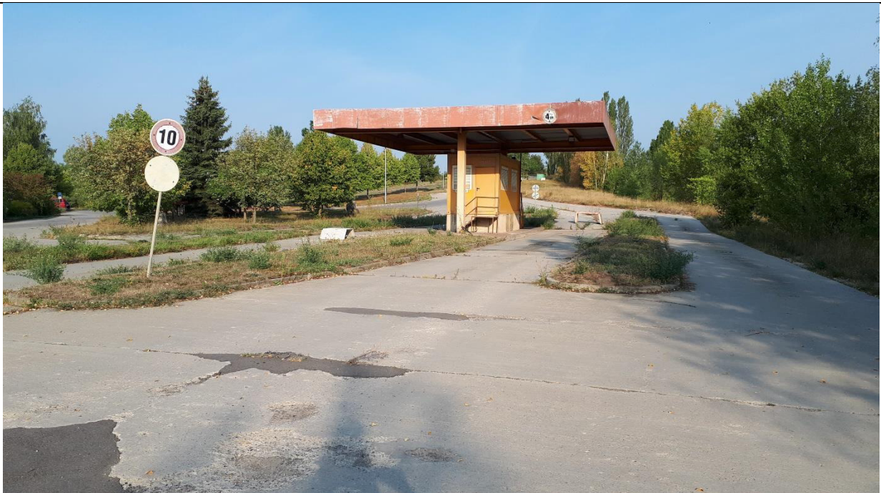
Bild 10: Blick von Süd nach Nord auf die bereits bestehende Waage. 28.08.2019