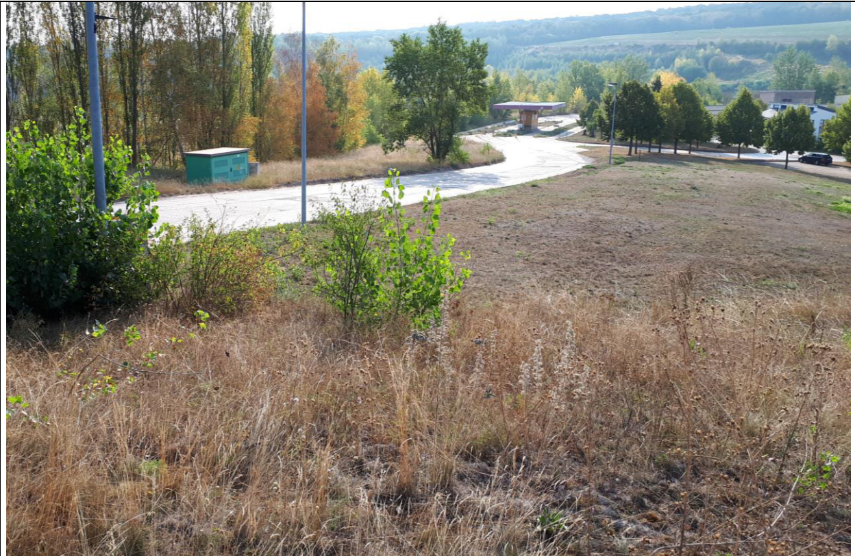
Bild 9: Eingangsbereich mit Zufahrtstraße (Betriebsstraße) zur geplanten Deponie und zum Gewerbegebiet. Links die Trafostation, in der Bildmitte die Waage und rechts hinter den Bäumen das Gewerbegebiet. Blickrichtung Südost, 28.08.2019