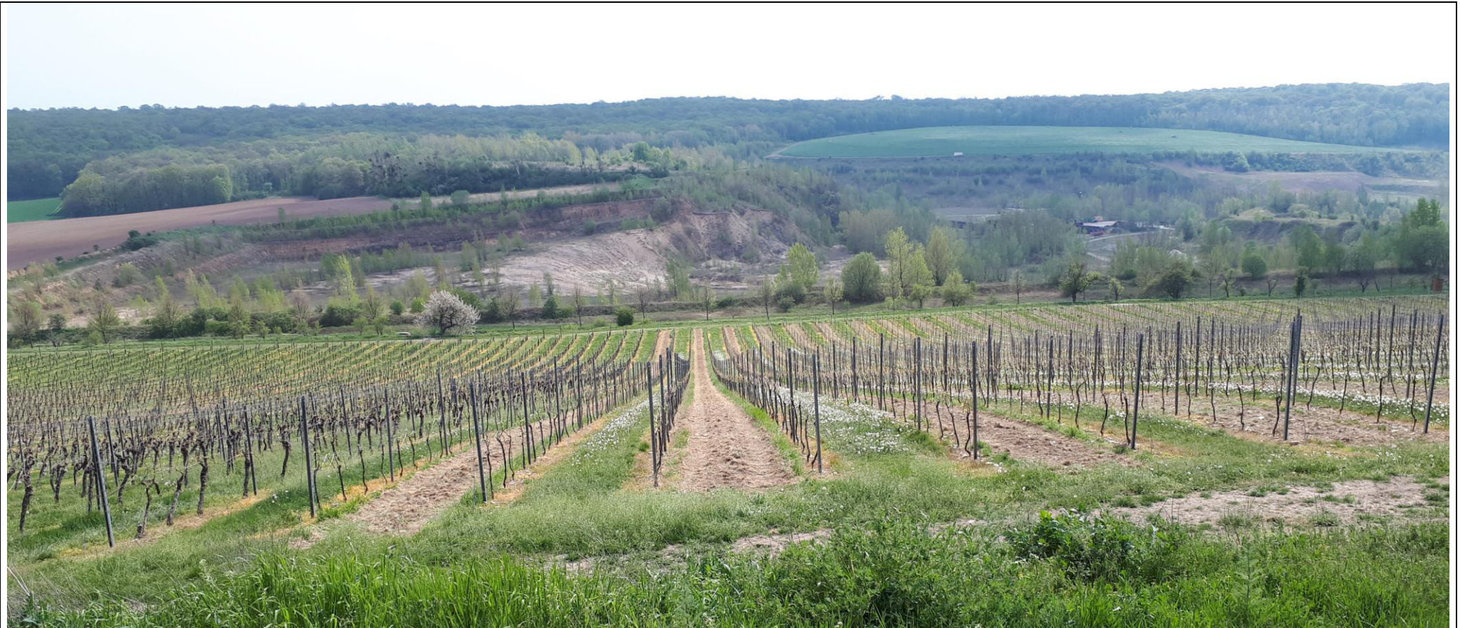
Bild 2: Blick aus Richtung Schleberoda nach Süden auf den noch nicht ausgekierten Teil des Kiessandtagebaus. Standplatz des Fotografen ist der Straßenknick der K 2640 südlich von Schleberoda. Im Vordergrund Weinanbau (Freyburger Mühlberg) entlang der B 176, die zwischen Kiegrube und den Weinbergen verläuft. Im Hintergrund ist die begrünzte Altdeponie, eingefasst in das Waldgebiet Alte Göhle, sichtbar. Die geplanten neuen Deponieteile schließen sich weiter westlich an (s. nachfolgendes Bild). 26.04.2019