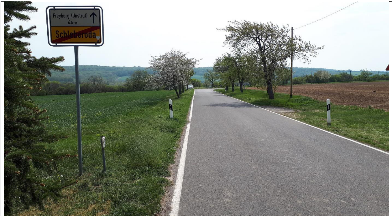
Bild 7: Blick vom Ortseingang Schleberoda in Richtung Süden. Im Hintergrund unterhalb des Waldes sind die begrünten Flächen der Altdeponie erkennbar. Aus dieser Position (Ortseingang) verdeckt der Hang den Blick auf die Flächen der geplanten Mineralstoffdeponie. 26.04.2019.