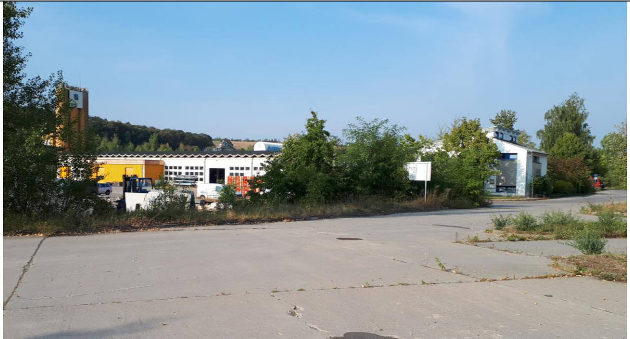
Bild 11: Blick von der Betriebsstraße auf das Gewerbegebiet in Richtung West. 28.08.2019