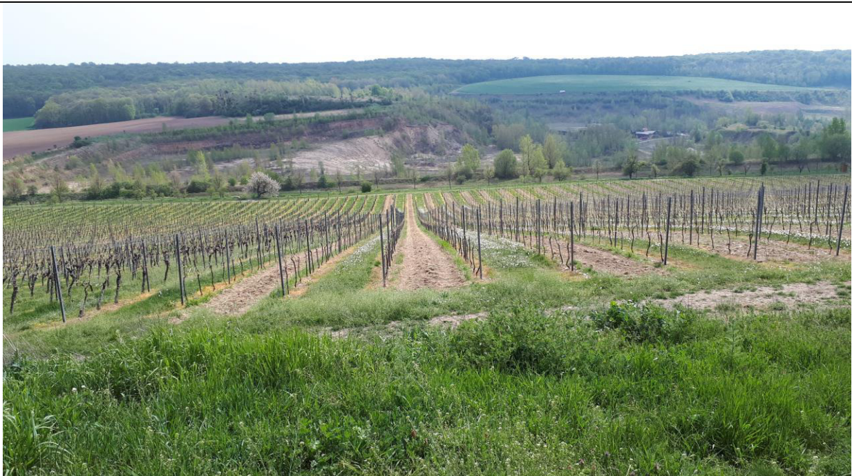
Bild 8: Blick vom Freyburger Mühlberg auf den östlichen Teil der Kiessandgrube. Im Hintergrund (rechte Bildhälfte) unterhalb des Waldes befindet sich die mit Gras bewachsene Altdeponie. Blickrichtung Süd 26.04.2019