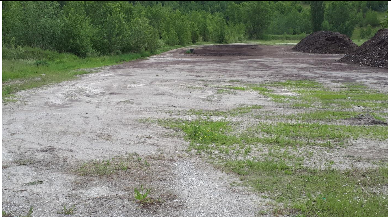
Bild 15: Grünschnitt- und Kompostplatz der AW-SAS AöR, östlich angrenzend an den geplanten DK 0-Bereich. Blickrichtung Süd, 28.05.2019