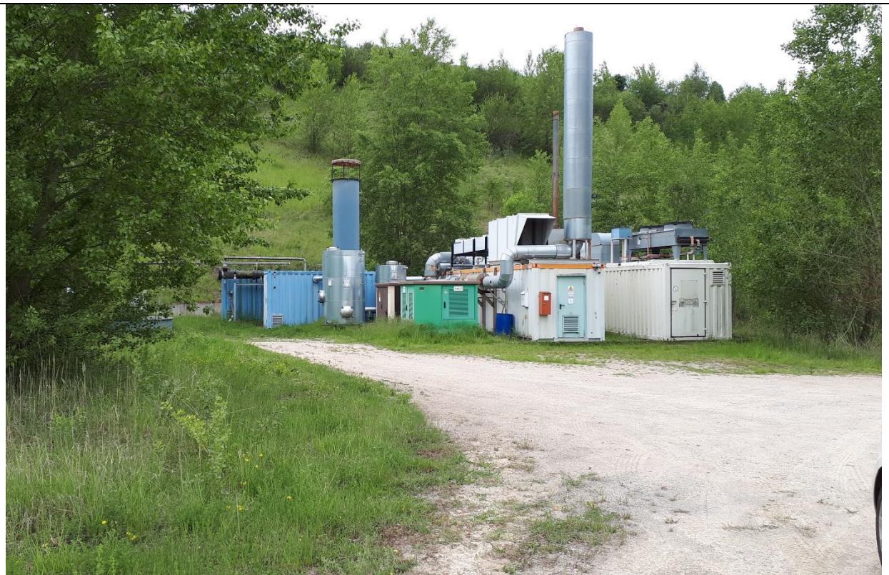
Bild 16: Verdichter-Fackelanlage am Böschungsfuß der Altdeponie zur Verbrennung von Deponiegas. 28.05.2019