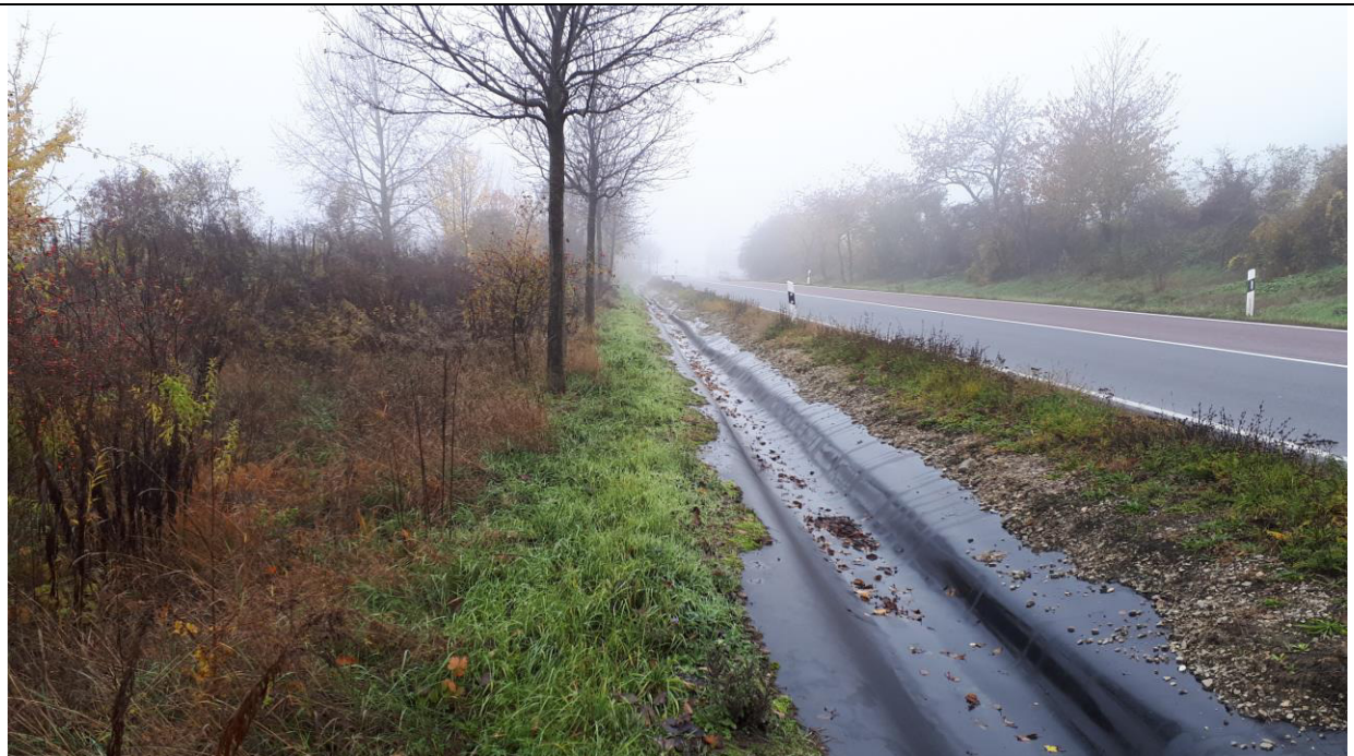
Bild 14: Um die Standsicherheit der Nordböschung des Kiessandtagebaus nicht zu gefährden, wurde der Entwässerungsgraben parallel zur Bundesstraße 176 auf der gesamten Länge des Tagebaus mit einer PE-Folie gesichert, die das Versickern von Niederschlagswässern im Graben verhindert. 22.11.2019.