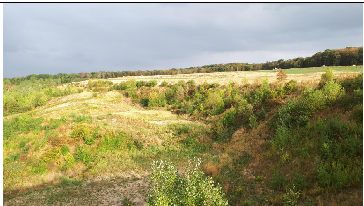
Bild 6: Blick von der Südwestböschung des Kiessandtagebaus in Richtung Osten auf die abgedeckte Altdeponie. 14.09.2018