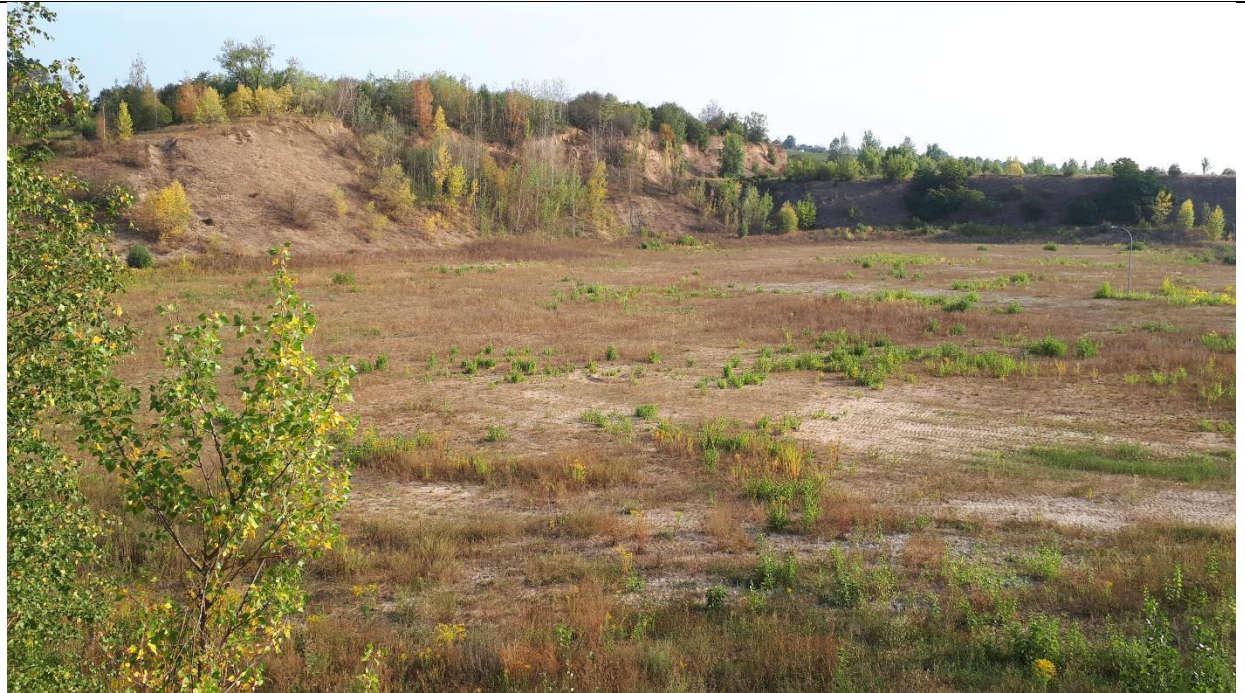
Bild 12: Bereich der geplanten DK I-Deponie. Blick Richtung Nordost auf die Steilböschung, die gemäß Abschlussbetriebsplan aus Standsicherheitsgründen angestützt werden muss. Der rechte schattige Teil ist der sogenannte Mitteldamm. 28.08.2019